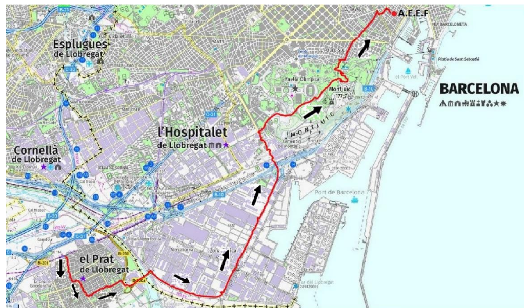
EL PRAT DE LLOBREGAT - BARCELONA 15,5Km. Altura máx. 131mtrs. Altura min. 12mtrs.